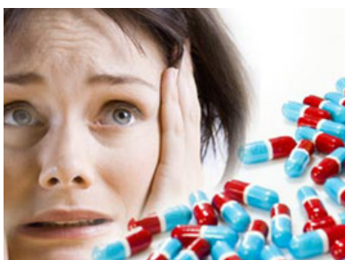
El fármaco ayuda a dejar la angustia y miedo que padecen las personas. ESPECIAL

Podría ayudar contra trastornos de ansiedad en las personas