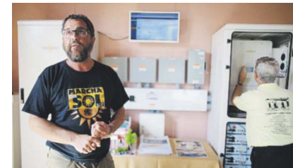
Elogia la labor de Casa Pueblo.